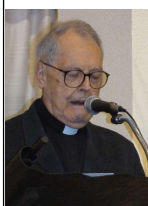
Con el P. de la Cueva

Nota: conviene asegurarse de que no ha habido cambios consultando al jefe de equipo.